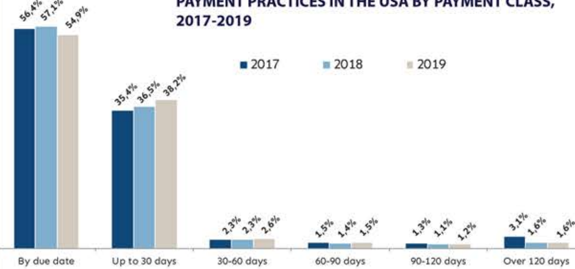
GRAPH 11.4 SOURCE: D&B INC. USA PAYMENT PRACTICES IN THE USA BY PAYMENT CLASS, 2017-2019

ABD'nin zamanında ödeme performansında her ne kadar önceki yıllara göre düşüş olsa da % 54,9 ile pozitif durumunu korumaktadır. Ancak 30 güne kadar olan gecikmelerde bir önceki yıla göre %1,7'lik artış yaşanırken 60 gün ve üzeri yaşanan gecikmelerde düşüşler göze çarpmaktadır. %65,7 ile en iyi ödeme gerçekleştiren sektör finansal hizmetler olmuştur.